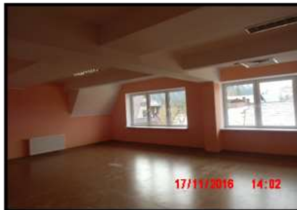
Biblioteka w Sromowcach Wyżnych