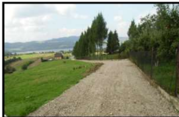
Odbudowa drogi do pól „Księża Droga” w Maniowach