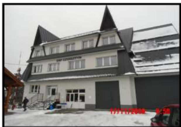
Termomodernizacja budynku remizy OSP w Czorsztynie