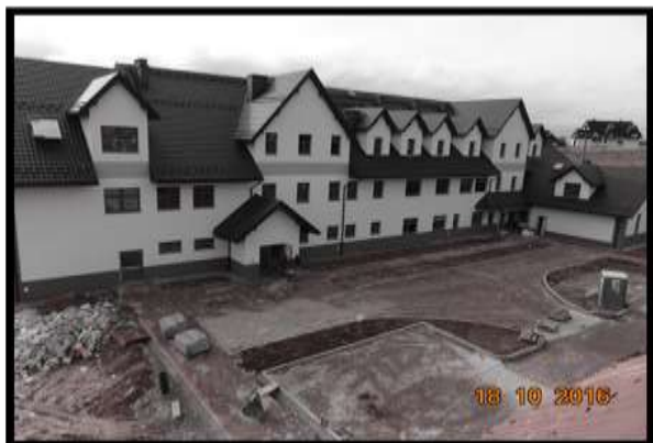
Budowa Szkoły w Kluszkowcach

Inwestycje w minionym roku w Gminie Czorsztyn nie brakowało. Modernizowano głównie infrastrukturę drogową tj. drogi polne oraz gminne, budynki użyteczności publicznej jak remiza strażacka, czy biblioteka a także zmierzono się z największą inwestycją ostatnich lat tj. budową szkoły podstawowej z dwuoddziałowym przedszkolem w sołectwie Kluszkowce, o czym przeczytać możecie Państwo poniżej.