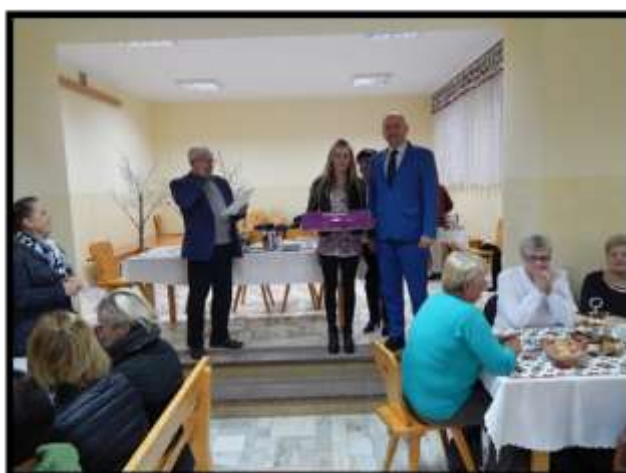
Wręczenie nagród za zajęcie I-go miejsca