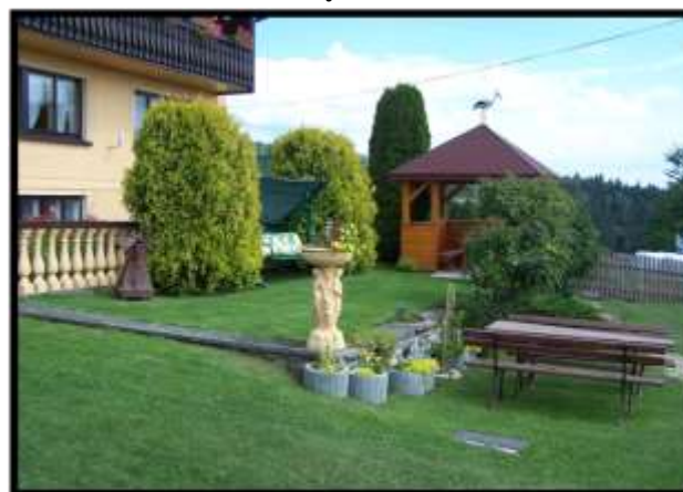
Beata Szumal – Huba