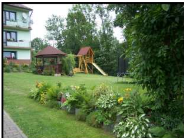
Lucyna Olejarz - Sromowce Wyżne