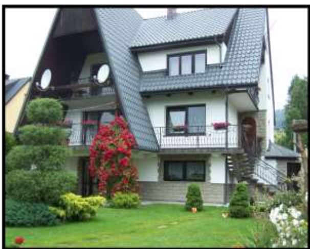
Elżbieta Regiec - Sromowce Niżne