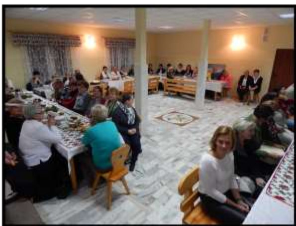
Podsumowanie „Mój ogród kwiatowy”